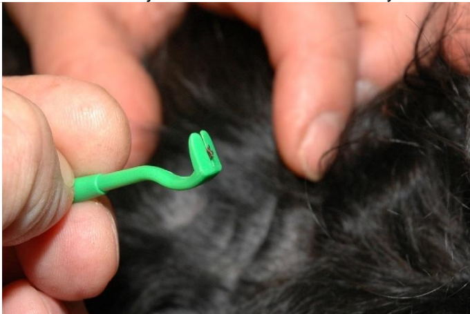
klíště se jednoduše odstraní i s kusadly