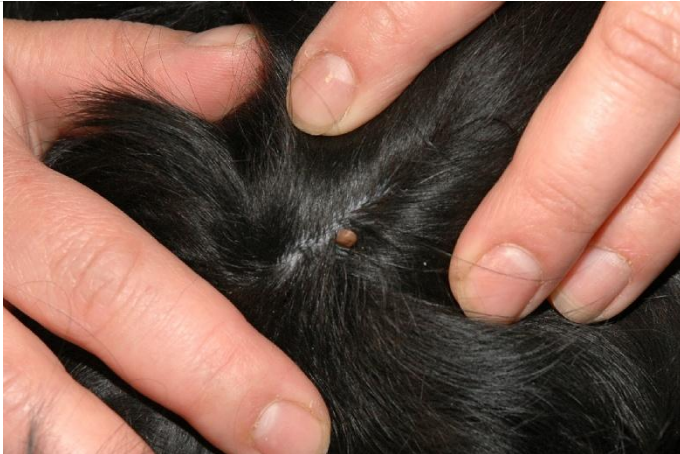
klíště přisáté na kůži