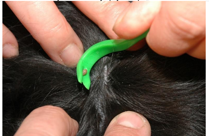
dvě vteřiny... a klíště je pryč resp. „na háčku“