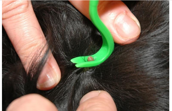
nasazení – „zaseknutí“ klíštěte do háčku