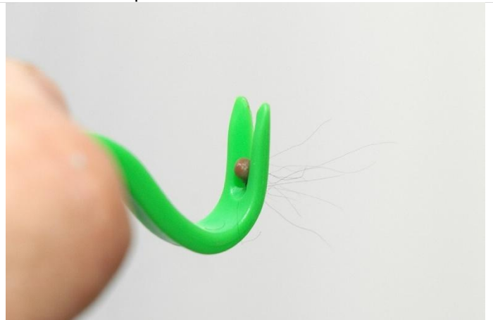
a bezpečně zůstane ve drážce háčku