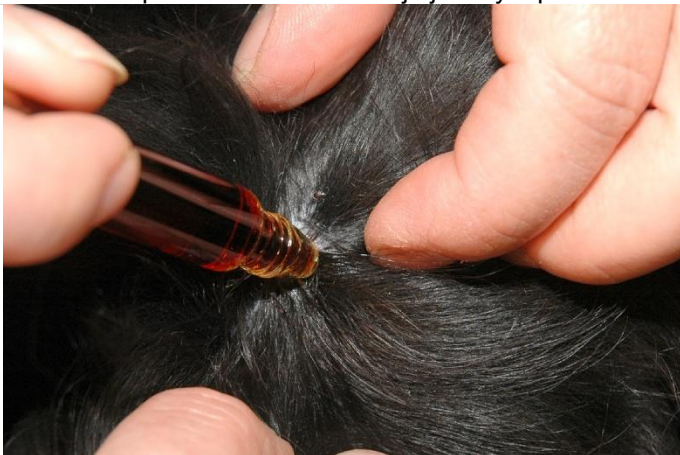
ranka po klíštěti se desinfikuje jodovým perem